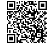
「改正物流効率化法の施行に伴う義務」 経済産業省